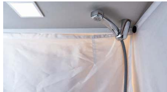
ComfortSpa bathroom. / ComfortSpa badkamer. / ComfortSpa-bad.