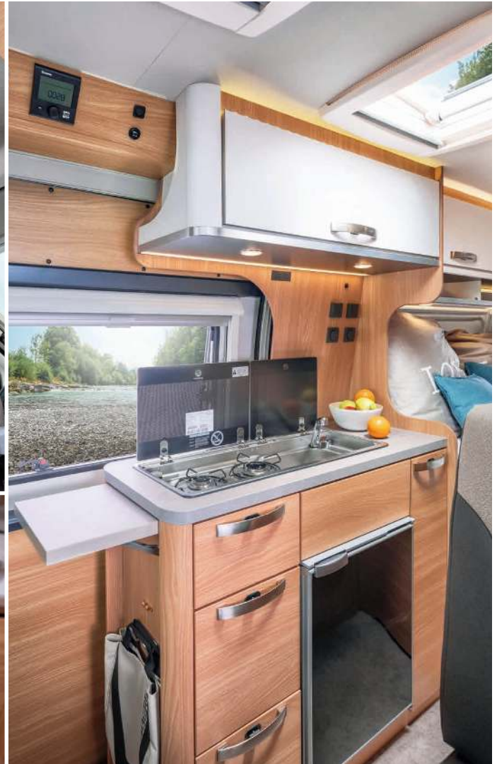
A straightforward kitchenette with a kitchen sink and electric ignition. ! Strak vormgegeven keukenblok met kook speelcombinatie met elektrische ontsteking. ! Retlinjet udformet køkkenfacade med kombineret komfur og opvask og elektrisk tænding.