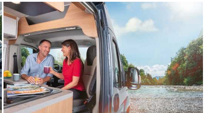
Turn cockpit seats toward the dinette and enjoy the legroom. ! Cockpit stolerne naar de dinette draaien en genieten van je beenvrijheid. ! Drej førersæderne hen imod dinetten og nyd benfriheden.