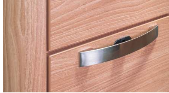
Furniture decor Mali Acacia. / Meubeldecor Mali Akazie. / Møbeldekor Mali Akacie.