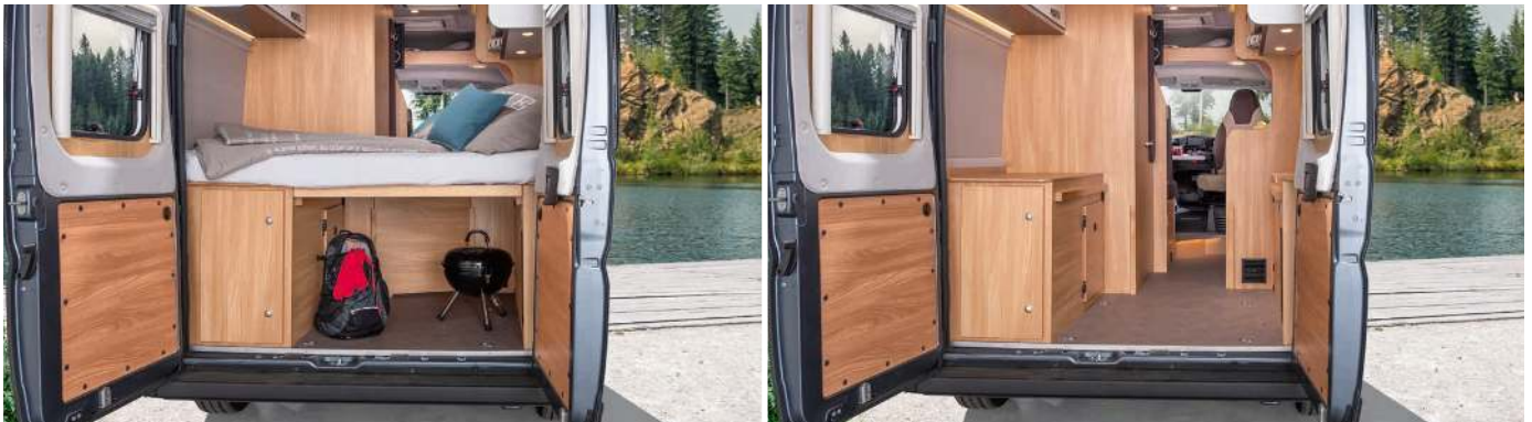
The double bed turns into a hatch. / Het tweepersoonsbed veranderd in een doorgeefruimte. / Dobbelt sengen bliver til en serveringslem.