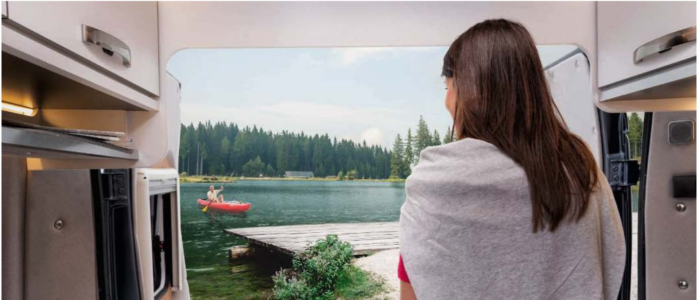
At one with nature with an open tailgate. / Eén met de natuur met open achterdeur. / Vær ét med naturen med åben bagdør.