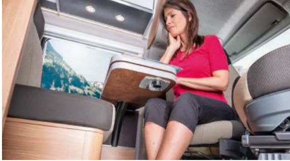
ComfortEntry table. / ComfortEntry tafel. / ComfortEntry bord.

Convincing with elaborated details. Overtuigd met doordachte details. Overbeviser ved gennemtænkte detaljer.