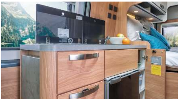
New kitchen block. / Nieuw keukenblok. / Ny køkkenblok.