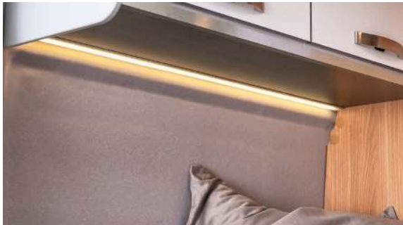
Breathable fabric cover. / Ademende stoffen bekleding. / Åndbart stoffetræk.