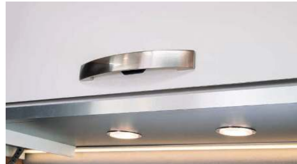
High-quality metalworking. / Hoogwaardige metalen afwerking. / Eksklusiv metalforbejdning.